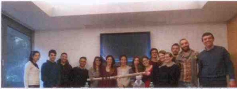
I quattordici ragazzi che hanno iniziato il tirocinio a Dicembre e i loro tutor della Fondazione Carsana