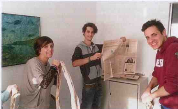
Un momento del corso di formazione e introduzione al lavoro dello scorso Ottobre, organizzato dalla Fondazione per i giovani tirocinanti che si immettono nel mondo del lavoro